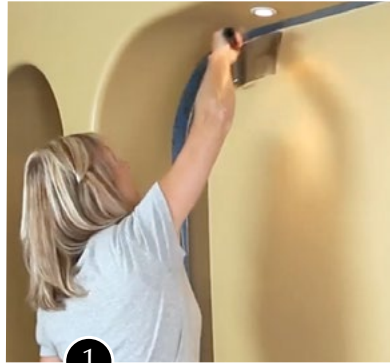
1 PREP IT PREPARACIÓN